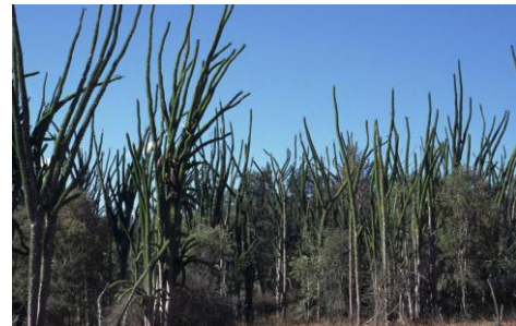
Forêt d' Alluaudia procera

Madagascar a été isolée pendant au moins 80 millions d'années et il y a des familles extraordinaires de plantes et d'animaux qui se sont créées.