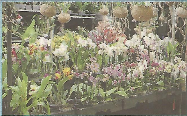
Les producteurs d'orchidées, fidèles au rendez-vous.

Le 5 e salon "Orchidées en fête" s'est tenu du vendredi 19 au dimanche 21 octobre.