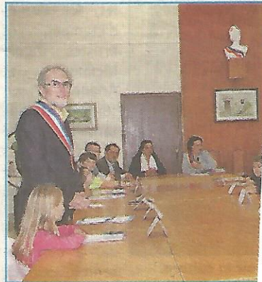
Le CME, la nouvelle insta

Le Conseil municipal des Enfants (CME) vient d'être lancé sur la commune.