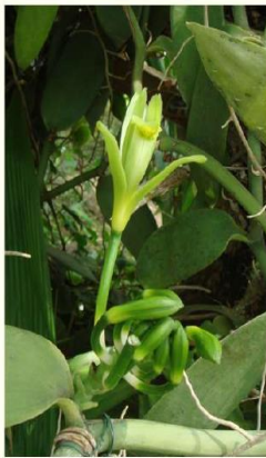
Tilixot chitl Vanilla planifolia